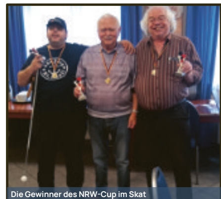
Die Gewinner des NRW-Cup im Skat