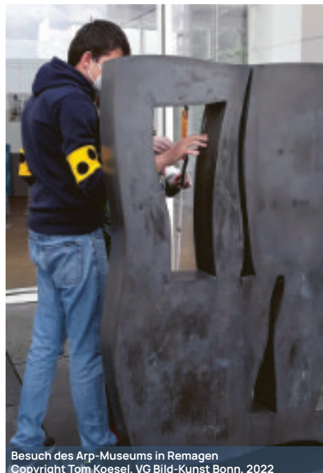
Besuch des Arp-Museums in Remagen